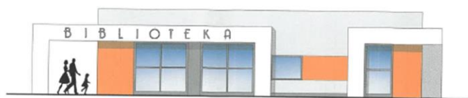
ELEWACJA POŁUDNIOWO-WSCHODNIA, skala 1:100 (od ulicy Morelowej)